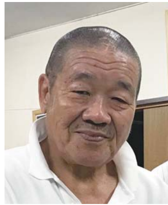
プロレスラー 藤原喜明

1973年 京都府立医科大学卒業 第一外科入局 1977年 秋田大学医学部外科 1982年 米国テキサス大学 ヒューストン校留学 1995年 京都府立医科大学 第一外科助教授 2000年 癌研究会附属病院 消化器外科 2015年 がん研究会有明病院 病院長 2018年 がん研究会有明病院 名誉院長 専門は消化器癌、特に胃癌